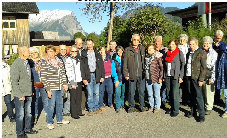
Übernachtungen im Hotel Edelweiss

Abfahrt ist um 8.00 Uhr bei der Volksbank Auf der Autobahn Ulm - Memmingen - Lindau - Bregenz - Dornbirn nach Schoppernau.